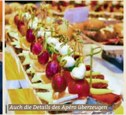
Auch die Details des Apéro überzeugen