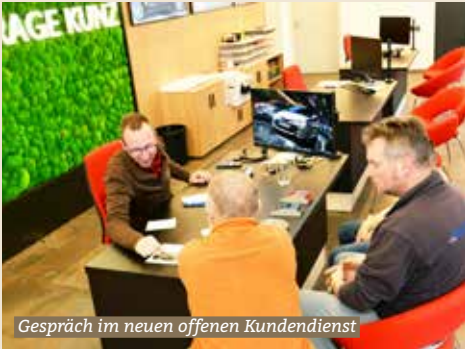
Gespräch im neuen offenen Kundendienst