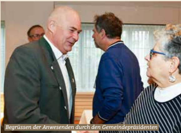
Begrüssen der Anwesenden durch den Gemeindepräsidenten