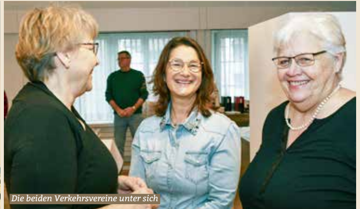
Die beiden Verkehrsvereine unter sich