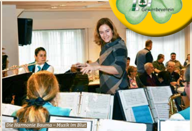
Die Harmonie Bauma – Musik im Blut