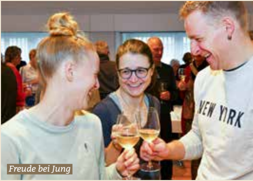
Freude bei Jung