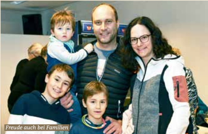
Freude auch bei Familien