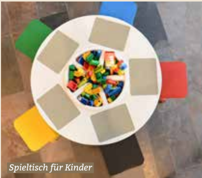
Spieltisch für Kinder