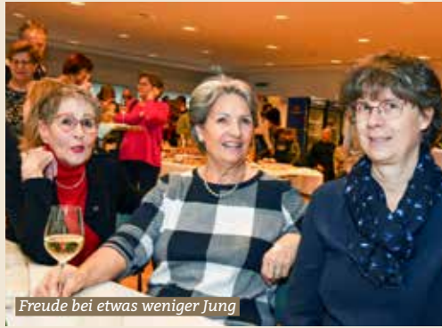
Freude bei etwas weniger Jung