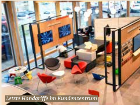
Letzte Handgriffe im Kundenzentrum