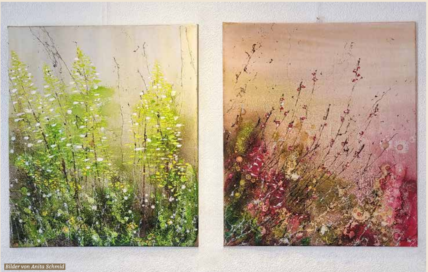
Bilder von Anita Schmid

Die Feiertage sind vorbei. Das neue Jahr beginnt in der Blumenau mit zauberhaften Bildern, ausgestellt im Haus Flieder. In verschiedenen Techniken führt Anita Schmid-Egli durch die Jahreszeiten. Kommen Sie, schauen Sie, Sie werden Ihre Freude daran haben!