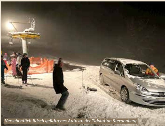
Versehentlich falsch gefahrenes Auto an der Talstation Sternenber

Meistens parkiert man an der Talstation eines Skilifts. Jedoch nicht bei uns im Sternenber.