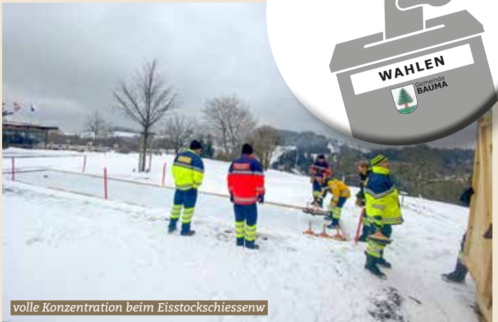
volle Konzentration beim Eisstockschiessen

Am 28. Januar 2023 trafen sich die Offiziere der Feuerwehr Bauma zur ersten Übung in diesem Jahr. Die Traktandenliste war vollgepackt mit verschiedenen Themen und Aufgaben, die zu erledigen waren. Damit die Arbeit daran in guter Umgebung und die gesteckten Ziele erreicht werden konnten, fand das Treffen im Gasthof Sunnebad, Sternenberg statt.