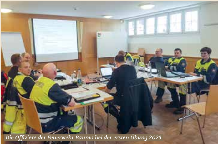
Die Offiziere der Feuerwehr Bauma bei der ersten Übung 2023