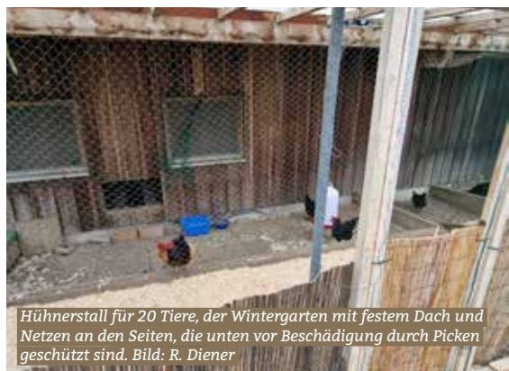
Hühnerstall für 20 Tiere, der Wintergarten mit festem Dach und Netzen an den Seiten, die unten vor Beschädigung durch Picken geschützt sind.