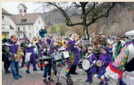
Die Turtalia Guggers scheppern um punkt 15 Uhr los