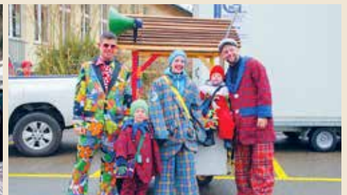
Clowns der Clown Gruppe «Schürli» Bäretswil