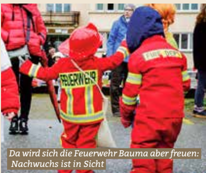
Da wird sich die Feuerwehr Bauma aber freuen: Nachwuchs ist in Sicht