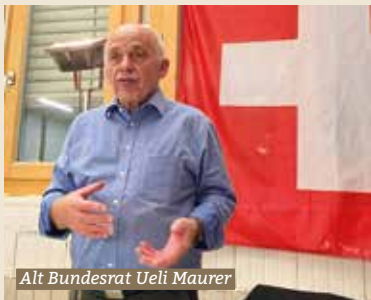
Alt Bundesrat Ueli Maurer