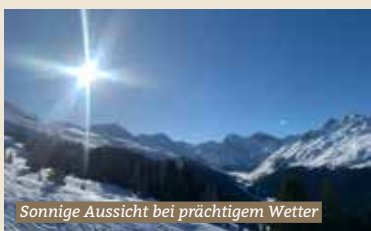
Sonnige Aussicht bei prächtigem Wetter

Am Freitagabend des zweiten Februarwochenendes trafen wir uns in Davos. Auf Umwegen konnten wir kurz nach unserer Ankunft ein feines Nachtessen geniessen. Unsere Zimmer hatten wir bereits in der Unterkunft «kleines Palace» nahe der Schatzalpbahn bezogen. Um unser Skiweekend richtig einzuläuten, zogen wir nach Burger und Pommes in die EX Bar weiter. Am Samstagmorgen begegnete man sich unterschiedlich fit am Zmorgenbuffet, trotz der kurzen Nacht waren wir schon früh auf dem Berg anzutreffen. Auf tollen Pisten mit prächtigem Wetter waren wir nicht die Einzigen, welche sich an den perfekten Bedingungen erfreuten. Nach flot-