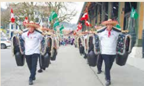
Die «Trychlerfründe Moslig» führten den Umzug an