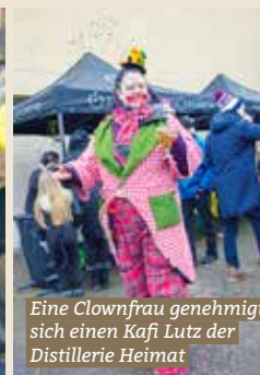
Eine Clownfrau genehmigt sich einen Kafi Lutz der Distillerie Heimat