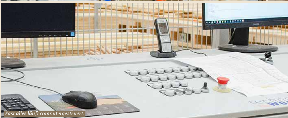
Fast alles läuft computergesteuert.