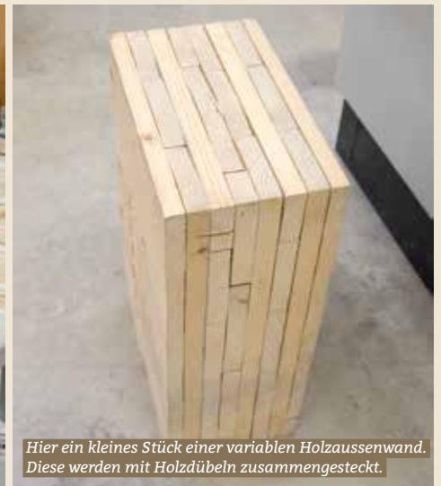
Hier ein kleines Stück einer variablen Holztaussenwand. Diese werden mit Holzdübeln zusammengesteckt.