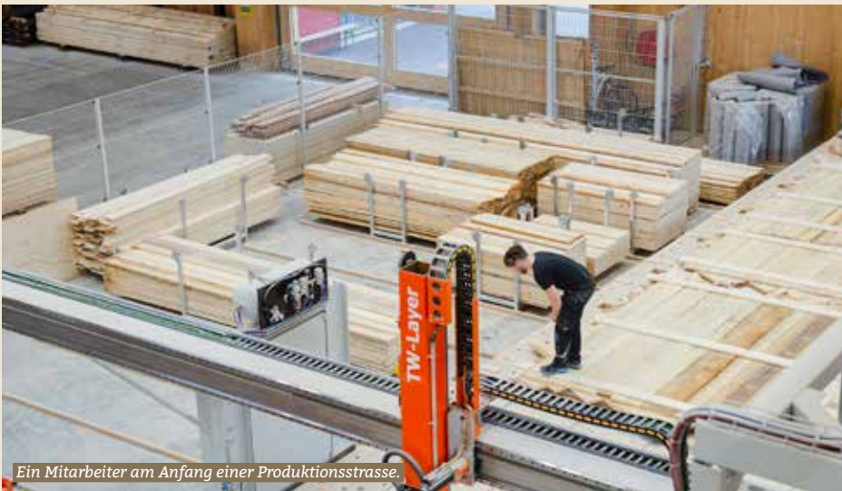
Ein Mitarbeiter am Anfang einer Produktionsstrasse.