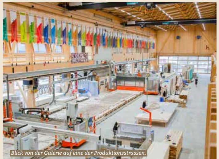
Blick von der Galerie auf eine der Produktionsstrassen.

Fährt man von Saland in Richtung Winterthur, fällt das imposante, mit Schindeln ummantelte Gebäude auf der linken Seite nach dem Bahnhof sofort auf. Dies ist die neue Produktionshalle Frauwis der Schindler & Scheibling AG, (folgend kurz S+S). Die Halle, in welcher von rund 20 Mitarbeitenden vorwiegend Elemente für den Bau der «HolzEcht»-Vollholzhäuser – ein System ohne Nägel, ohne Schrauben und ohne Chemie – hergestellt werden, ist 85 Meter lang, 45 Meter breit und 17 Meter hoch. Ein riesiges Gebäude also, welches in einer einzigartigen Holzkonstruktion gebaut wurde.