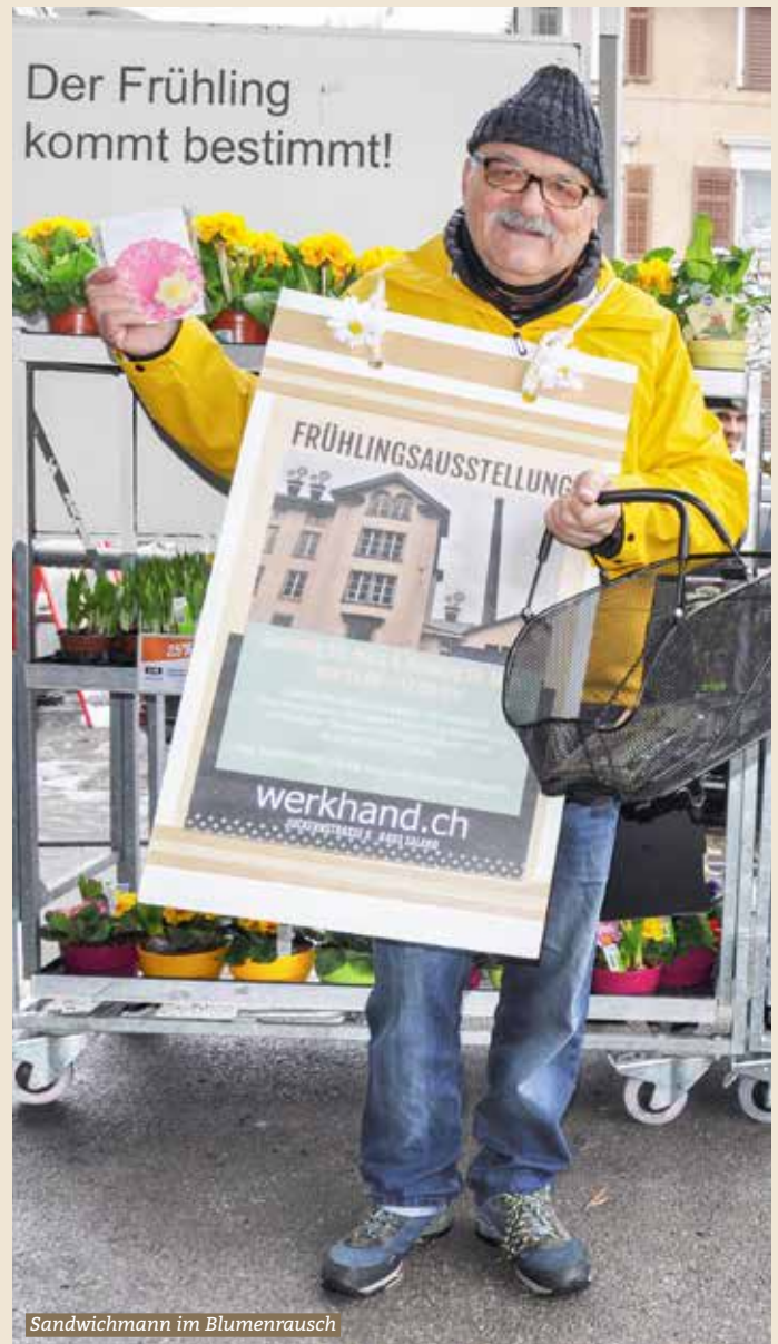
Sandwichmann im Blumenrausch