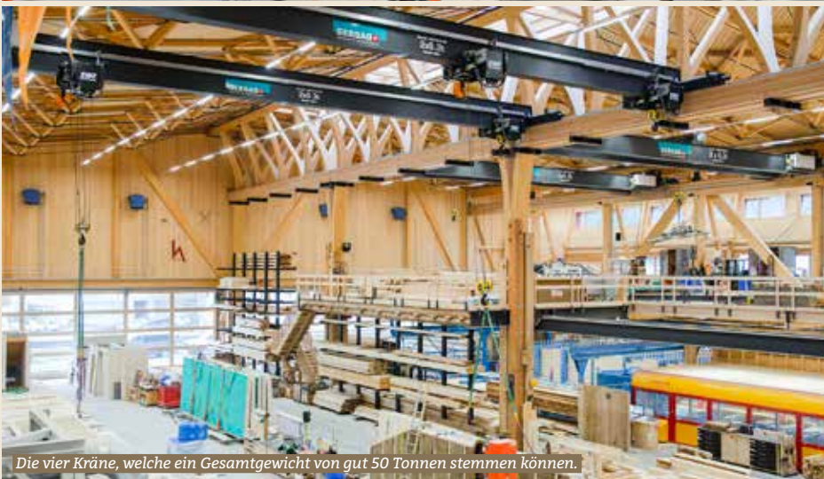
Die vier Kräne, welche ein Gesamtgewicht von gut 50 Tonnen stemmen können.