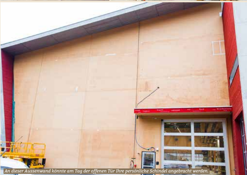
An dieser Aussenwand könnte am Tag der offenen Tür Ihre persönliche Schindel angebracht werden.