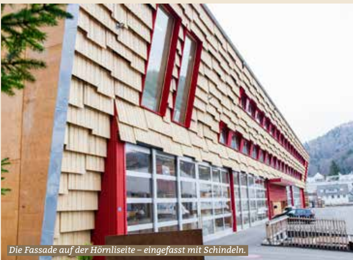
Die Fassade auf der Hörnliseite – eingefasst mit Schindeln.