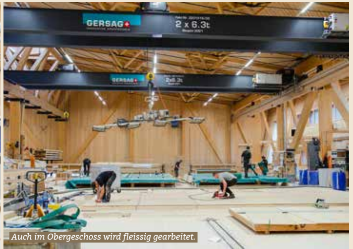
Auch im Obergeschoss wird fleissig gearbeitet.