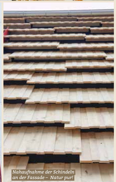
Nahaufnahme der Schindeln an der Fassade – Natur pur!