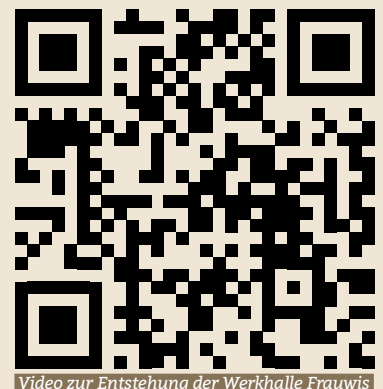
Video zur Entstehung der Werkhalle Frauwis