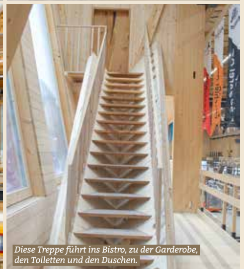
Diese Treppe führt ins Bistro, zu der Garderobe, den Toiletten und den Duschen.