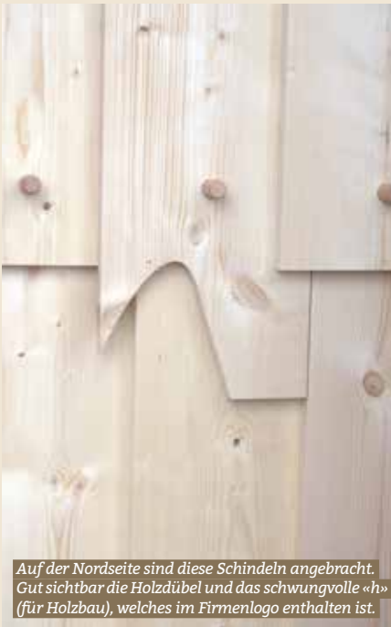
Auf der Nordseite sind diese Schindeln angebracht. Gut sichtbar die Holzdübel und das schwungvolle «h» (für Holzbau), welches im Firmenlogo enthalten ist.

In diesem Sinne und wie es anlässlich der Aufrichte zu hören war: «Frauwis – priis»!