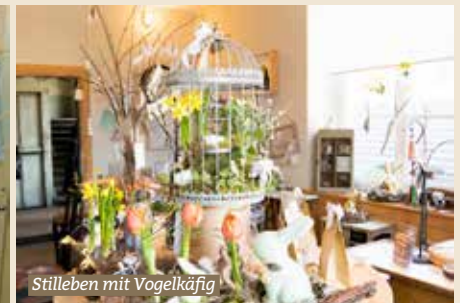
Stilleben mit Vogelkäfig

Die Sonne zeigte sich vor dem kalendarischen Frühlingsanfang über das Wochenende nur zaghaf. Einzig die Temperaturen bewegten sich zwischen 15 und 18 Grad. Wer mit diesen Wetterprognosen die Ausstellung in den Räumen von Werkhand.ch in Saland besuchte, konnte so zumindest am Frühling schnuppern. Die verschiedenen Prophezeiungen über den Frühling schienen sich zu bewahrheiten. Denn nicht nur die Flora und Fauna gaben ihr Bestes, auch der Mensch scheint in diesen Tagen wie verwandelt. So erklärte sich auch eine erfreuliche Besucherzahl, welche die angekündigten Exponate entdecken wollte. Es galt unter anderem all die kleinen Kunstwerke zu begutachten. Quasi eine Zeitreise in ein Miniaturland. Denn ein Teil der Präsentationen umfasste aktuelle Frühlingsgestecke auf Rinden sowie in Konservendosen, Türkränze und Osterdekorationen. So kämpften in einem Raum Narzissen, Stiefmütterchen mit Upcycling-Möbeln um die Gunst der Besucher. «Ich kann mich kaum von diesen Schmuckstücken