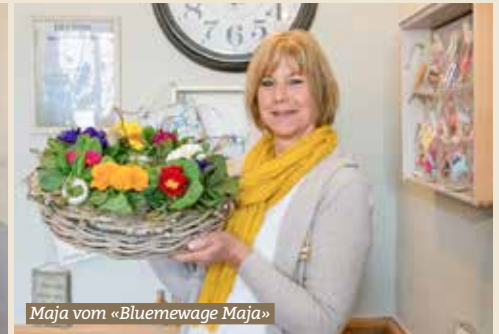
Maja vom «Bluemewage Maja»