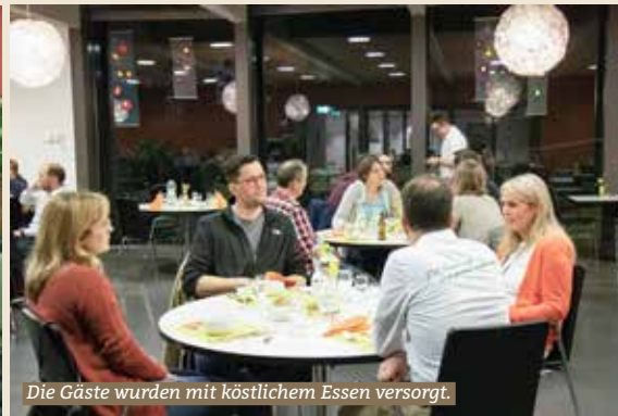
Die Gäste wurden mit köstlichem Essen versorgt.