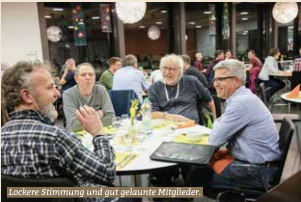
Lockere Stimmung und gut gelaunte Mitglieder.