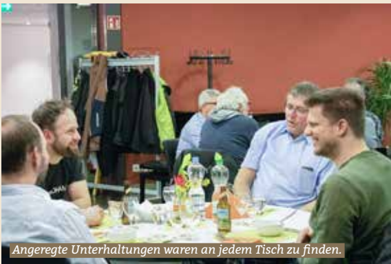
Angeregte Unterhaltungen waren an jedem Tisch zu finden.