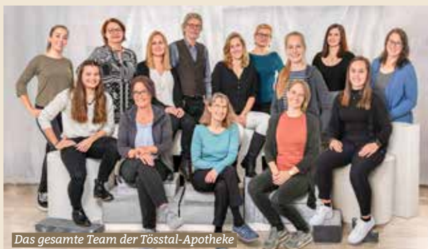
Das gesamte Team der Tösstal-Apotheke