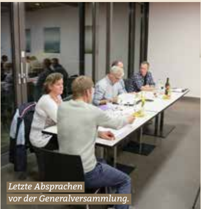
Letzte Absprachen vor der Generalversammlung.