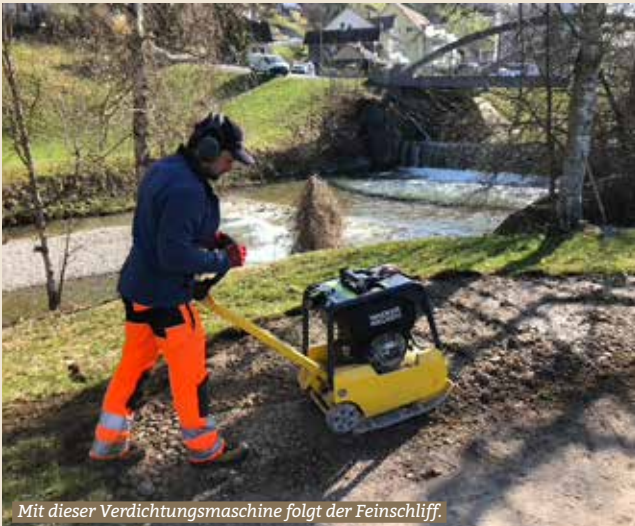
Mit dieser Verdichtungsmaschine folgt der Feinschliff.