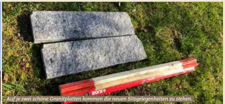
Auf je zwei schöne Granitplatten kommen die neuen Sitzgelegenheiten zu stehen.