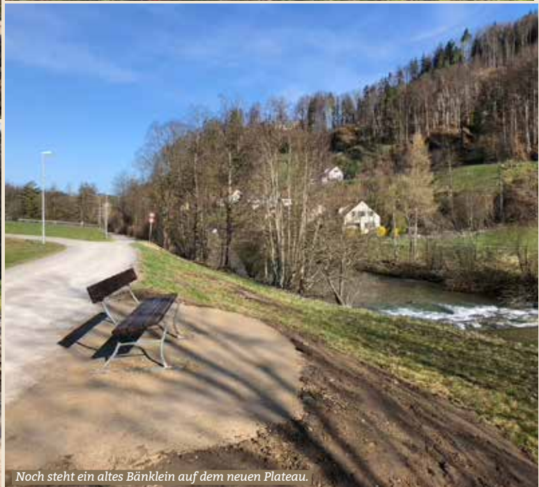
Noch steht ein altes Bänklein auf dem neuen Plateau.