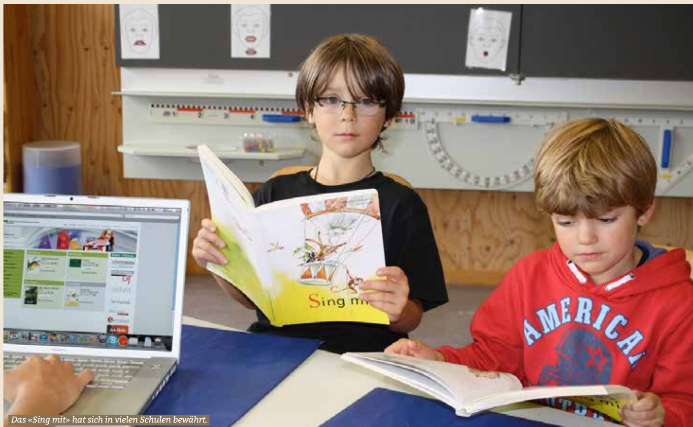
Das «Sing mit!» hat sich in vielen Schulen bewährt.