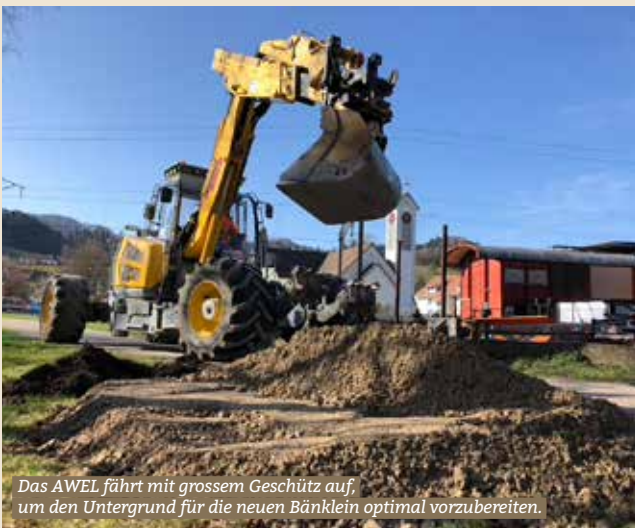
Das AWEL fährt mit grossem Geschütz auf, um den Untergrund für die neuen Bänklein optimal vorzubereiten.