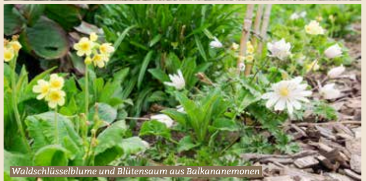
Waldschlüsselblume und Blütensaum aus Balkananemonen