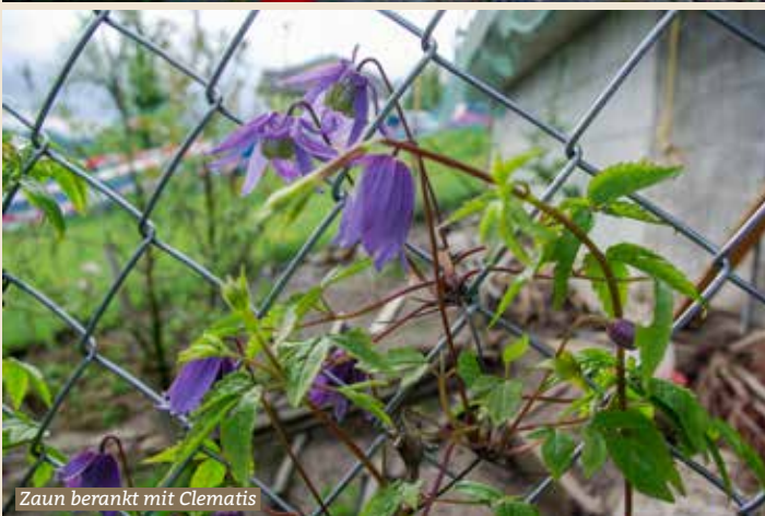
Zaun berankt mit Clematis