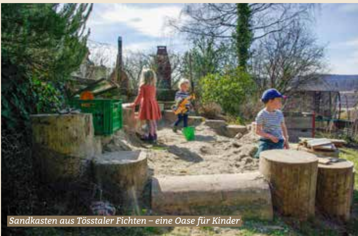
Sandkasten aus Tösstaler Fichten – eine Oase für Kinder

Damit sie Ihr Gartenwohl finden freut sich die Roda Naturgärten über Ihre Kontaktaufnahme unter der E-Mailadresse: info@roda-naturgaerten.ch oder der Telefonnummer 079 157 29 74.