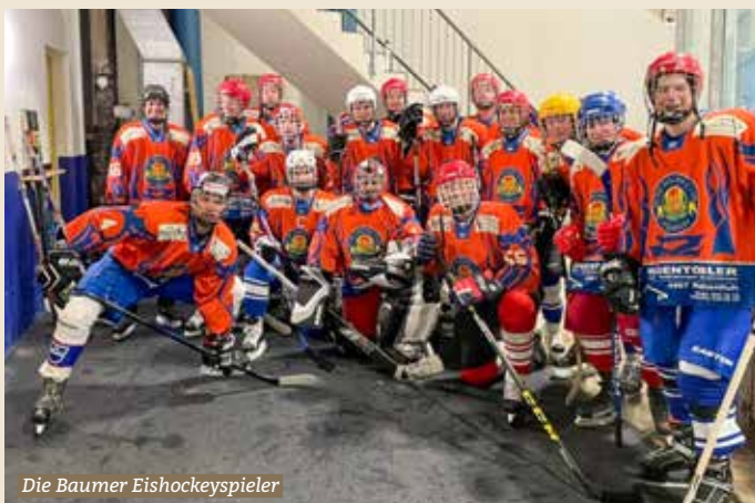
Die Baumer Eishockeyspieler

Am 16. April fand in der Eishalle Bärenswil das alljährliche Eishockeyturnier statt. Insgesamt sind 5 Teams auf dem Eis gestartet von den verschiedenen Turnvereinen Russikon, Hittnau, Fehraltorf und Wislig. Vom Turnverein Bauma nahmen ebenfalls stolze 16 Personen teil. In der ersten Runde des Turniers sind die Baumer gegen die Russiker angetreten. Diese Runde konnte Russikon knapp gewinnen. Bei dem nächsten Spiel mussten wir leider wieder einstecken, nämlich gegen den Verein Fehraltorf. In der letzten Runde gegen Hittnau konnten wir das Spiel jedoch für uns entscheiden und gewinnen. Wir möchten noch ganz herzlich bei dem tollen Publikum bedanken, dass mit uns den einen Sieg feierte.