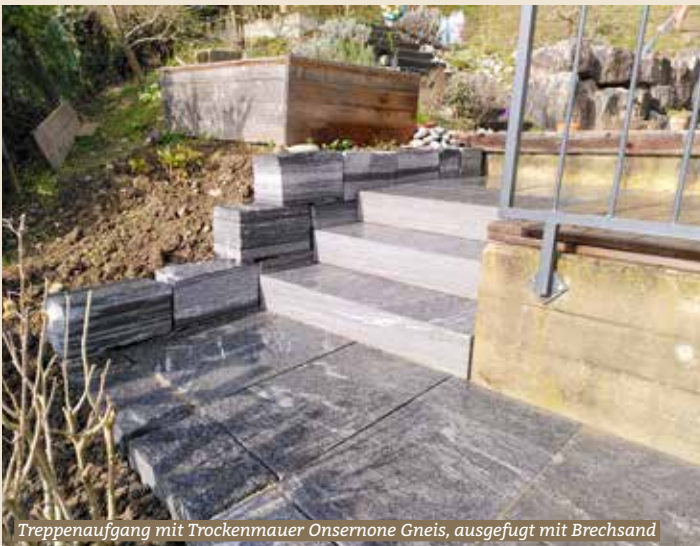
Treppenaufgang mit Trockenmauer Onsemone Gneis, ausgefugt mit Brechsand