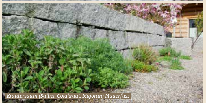
Kräutersaum (Salbei, Colakraut, Majoran) Mauerfuss