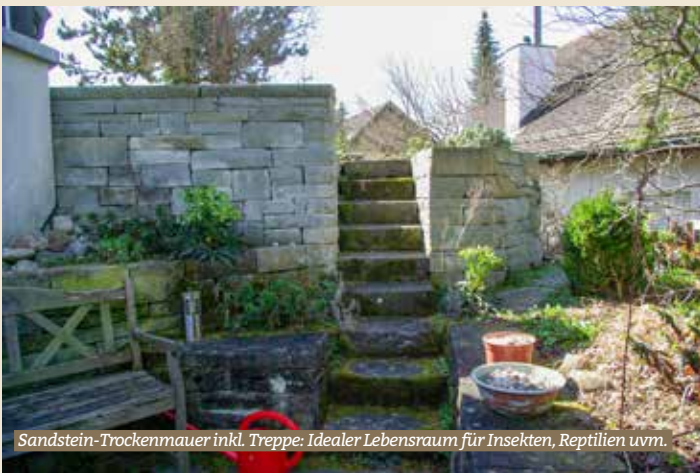
Sandstein-Trockenmauer inkl. Treppe: Idealer Lebensraum für Insekten, Reptilien uvm.