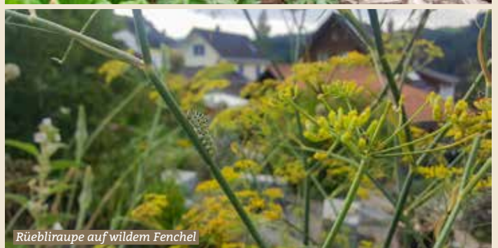
Rüebli-raupe auf wildem Fenchel