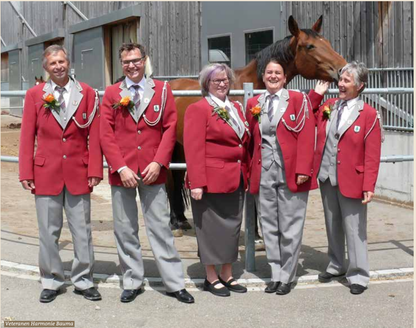
Veteranen Harmonie Bauma