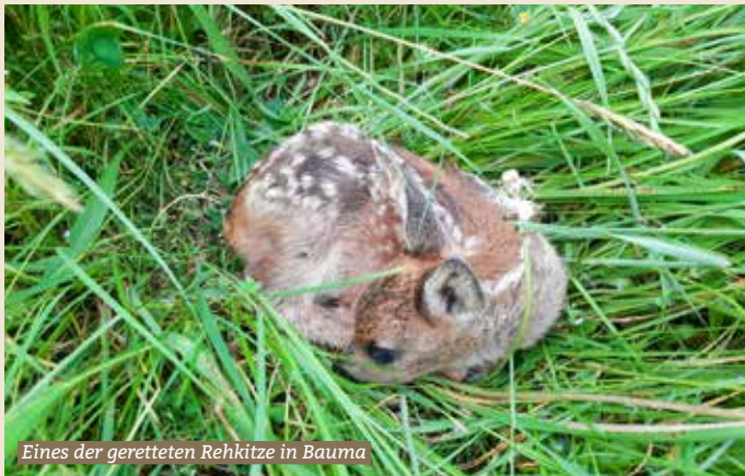
Eines der geretteten Rehkitze in Bauma