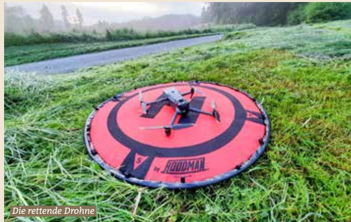
Die rettende Drohne

Am letzten Freitag fand der zweite Drohneneinsatz im Jagdrevier Bauma II statt. Diese Technik wird seit diesem Jahr nebst dem konventionellen Verblenden der Wiesen eingesetzt. Das Team, bestehend aus Drohnenpilot von rehkitzrettung.ch, Jäger und freiwilligem Helfer und auch die Drohne funktionierte perfekt und so konnten schon