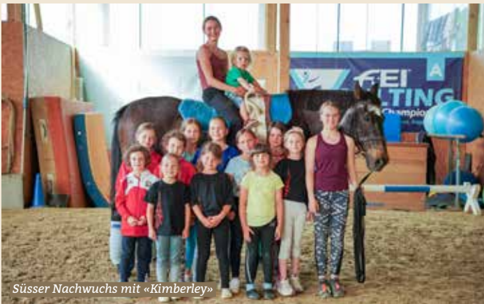
Süsser Nachwuchs mit «Kimberley»