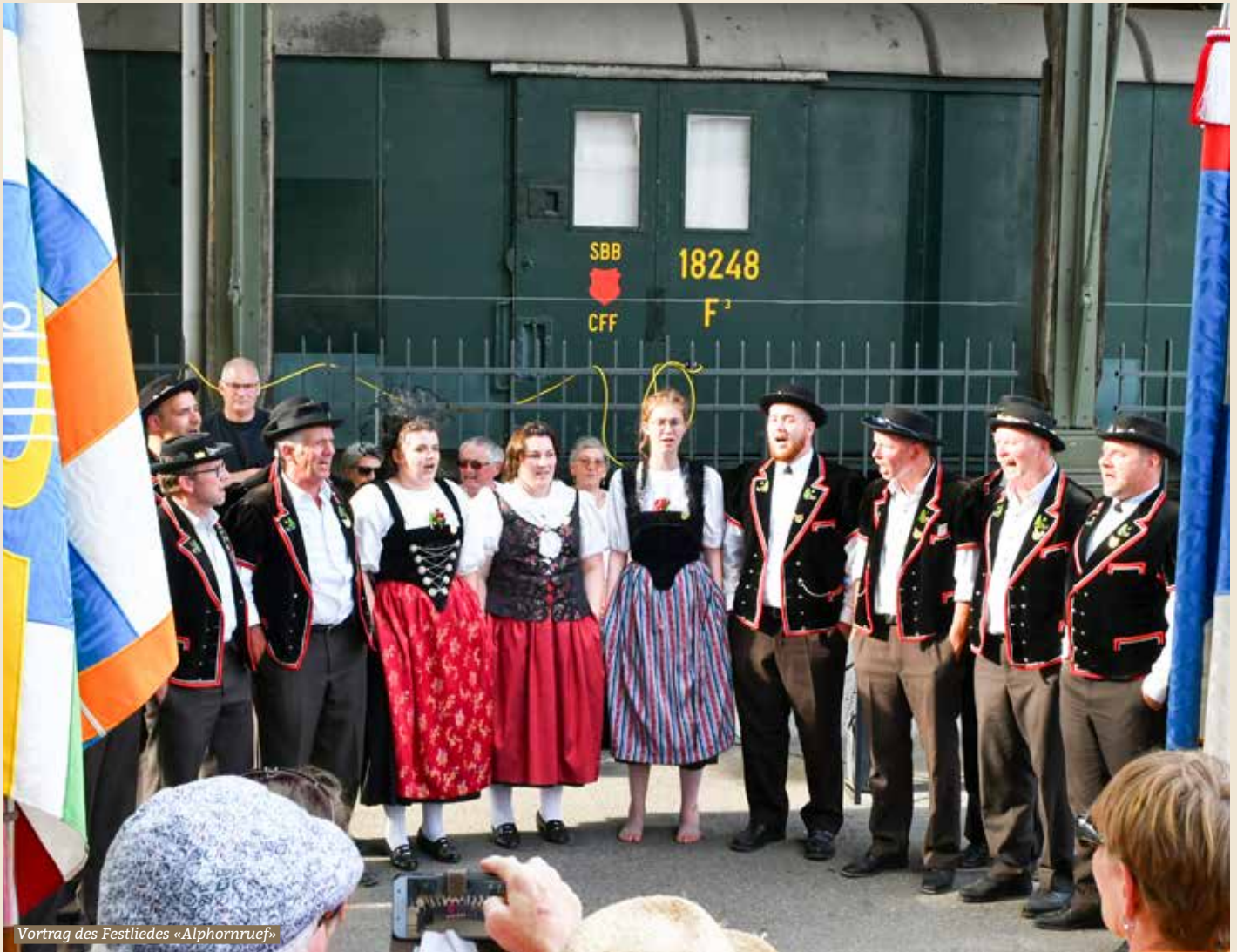
Vortrag des Festliedes «Alphornruef»

Sechs lange Jahre mussten die Jodlerinnen und Jodler auf den grossen Anlass warten. Gemeint ist das 31. Eidgenössische Jodlerfest, welches während des vergangenen Wochenendes in Zug stattfand. Mit dem Motto «traditionell – überraschend – vielseitig» präsentierten sich nicht weniger als 10'000 aktive Jodlerinnen und Jodler, Fahnen-schwingerinnen und Fahnen-schwinger sowie Alphornbläserinnen und Alphornbläser der Jury und der Bevölkerung. Mittendrin auch das Chelleländer Jodelchörli Bauma.