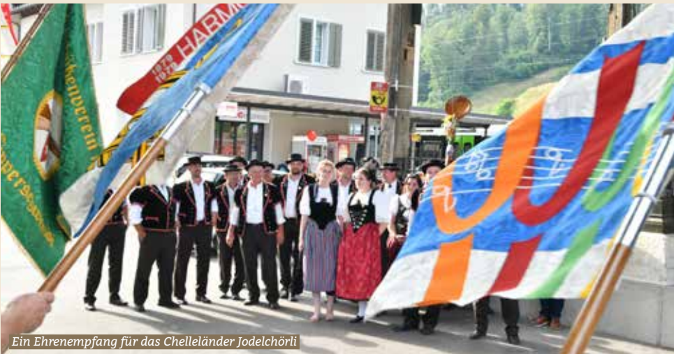
Ein Ehrenempfang für das Chelländer Jodelchörli