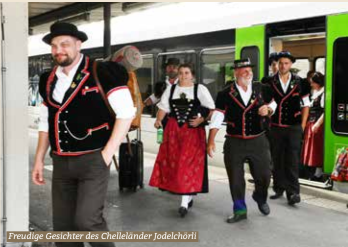
Freudige Gesichter des Chelländer Jodelchörli