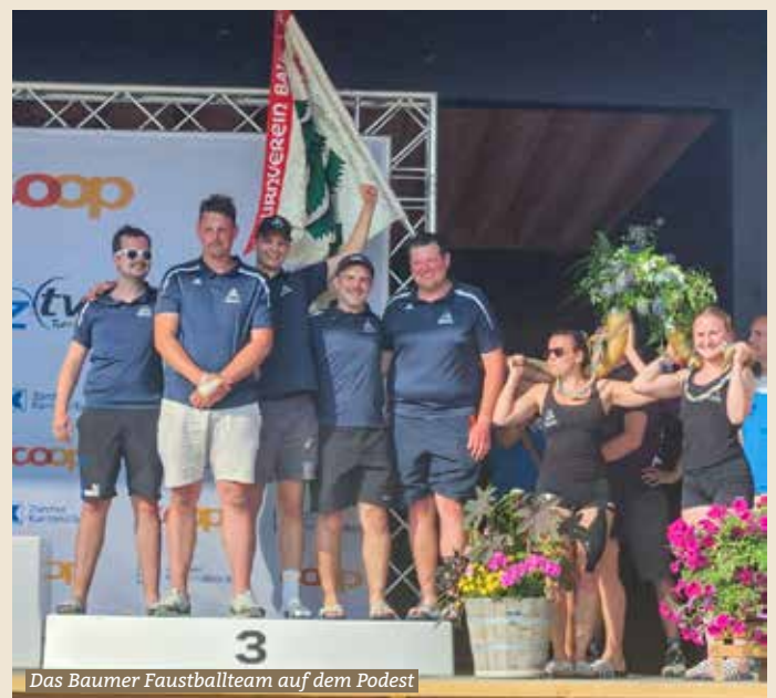
Das Baumer Faustballteam auf dem Podest