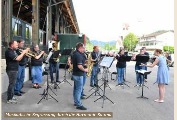
Musikalische Begrüssung durch die Harmonie Bauma