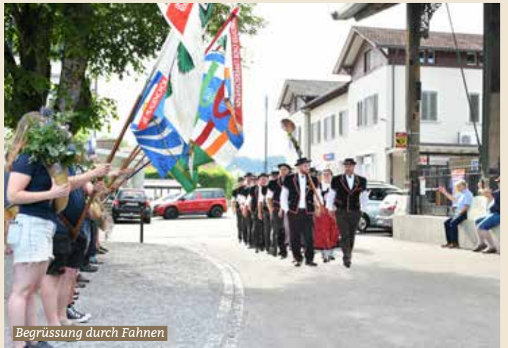
Begrüssung durch Fahnen