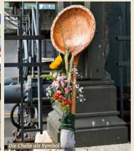
Die Chelle als Symbol