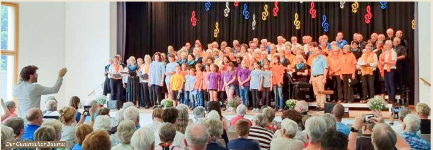
Der Gesamtchor Bauma

Singen macht Spass und Singen tut gut und zu hören ist es oft ein Genuss!