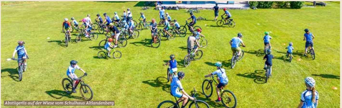
Abstiegerlis auf der Wiese vom Schulhaus Altlandenberg

Am letzten Samstag fand das 30-jährige Jubiläum des VC Bauma bei traumhaftem Wetter statt.