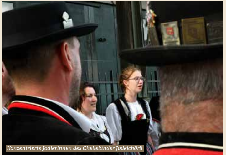
Konzentrierte Jodlerinnen des Chelländer Jodelchörli