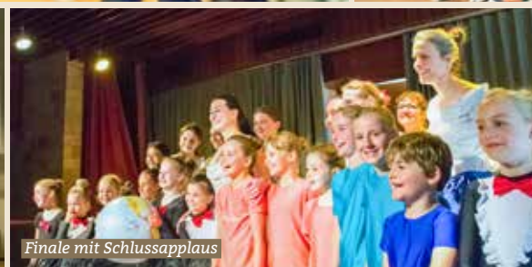
Finale mit Schlussapplaus