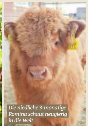
Die niedliche 3-monatige Romina schaut neugierig in die Welt