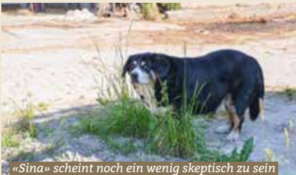
«Sina» scheint noch ein wenig skeptisch zu sein