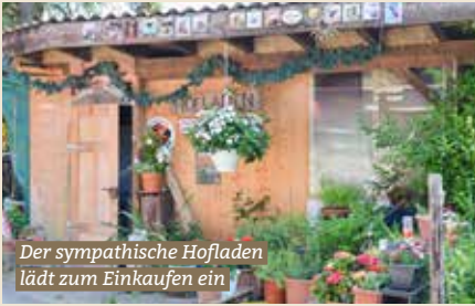
Der sympathische Hofladen lädt zum Einkaufen ein

weitere Impressionen vom Highlandhof Scherer Burch