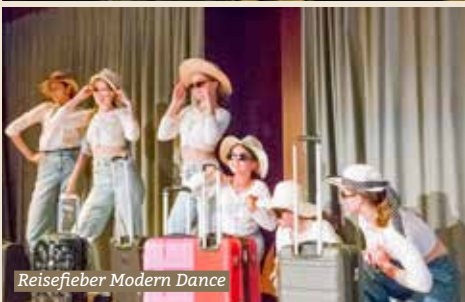
Reisefieber Modern Dance