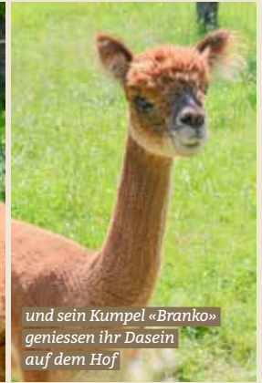
und sein Kumpel «Branko» geniessen ihr Dasein auf dem Hof