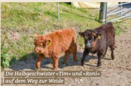
Die Halbgeschwister «Tim» und «Roni» auf dem Weg zur Weide