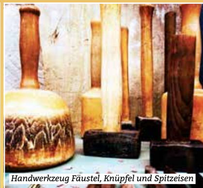
Handwerkzeug Fäustel, Knüpfel und Spitzseisen