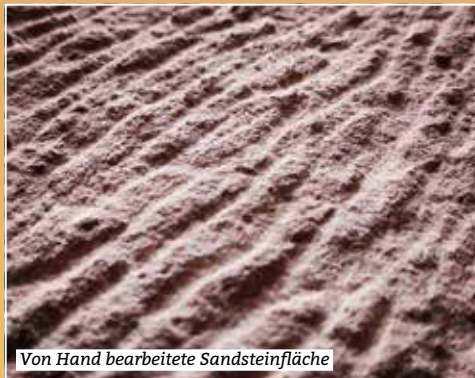
Von Hand bearbeitete Sandsteinfläche