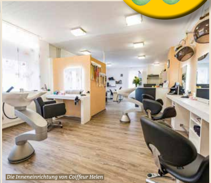
Die Inneneinrichtung von Coiffeur Helen