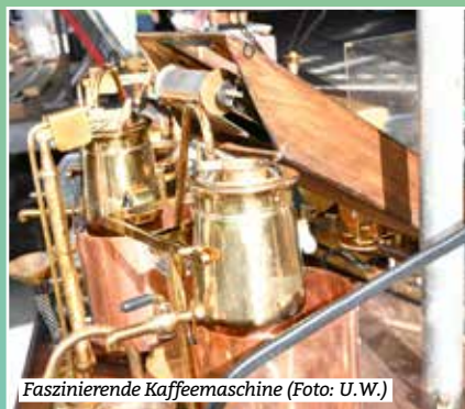
Faszinierende Kaffeemaschine