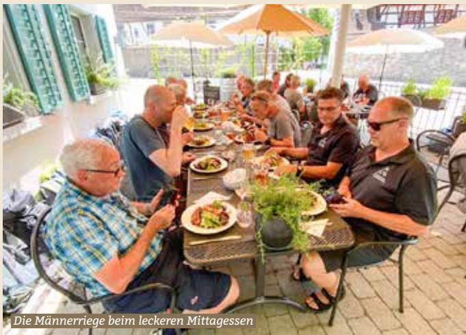
Die Männerriege beim leckeren Mittagessen

Das Motto der Reise war «Rhein, Wein, glücklich sein». Die 19 Männerriegler kamen dabei voll auf ihre Rechnung. Im Schloss Teufen gab's zu den spannenden Informationen über das Schloss, den Landwirtschaftsbetrieb und die Weinproduktion fruchtigen Wein zu degustieren. Eglisau, unser nächster Treffpunkt, erreichten die einen zu Fuss, andere mit dem ÖV oder sogar schwimmend im Rhein.