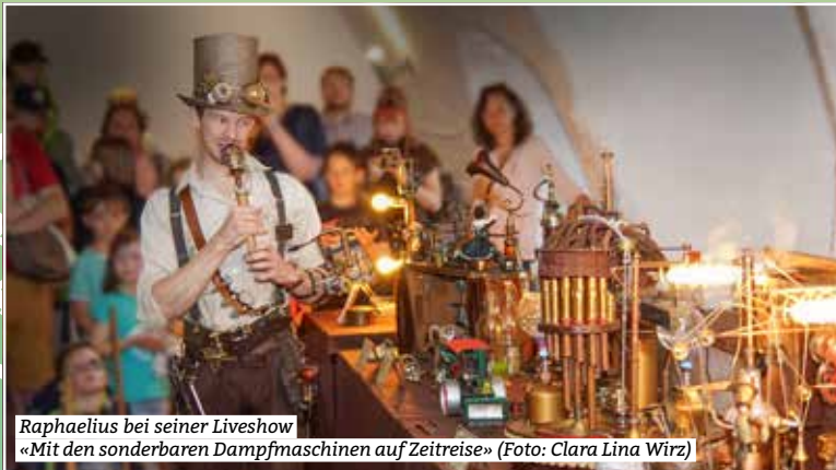
Raphaelius bei seiner Liveshow «Mit den sonderbaren Dampfmaschinen auf Zeitreise»