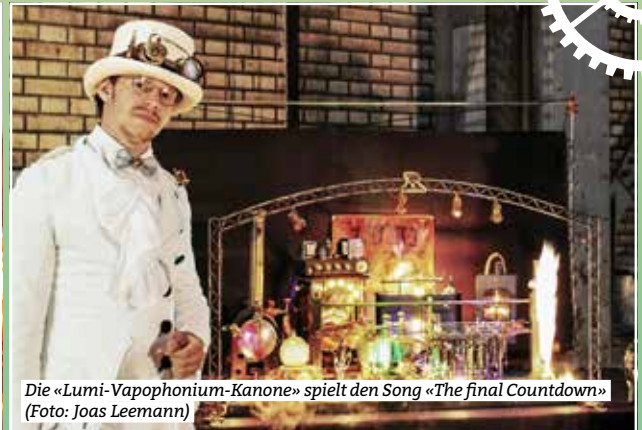
Die «Lumi-Vapophonium-Kanone» spielt den Song «The final Countdown»