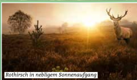
Rothirsch in nebligem Sonnenaufgang