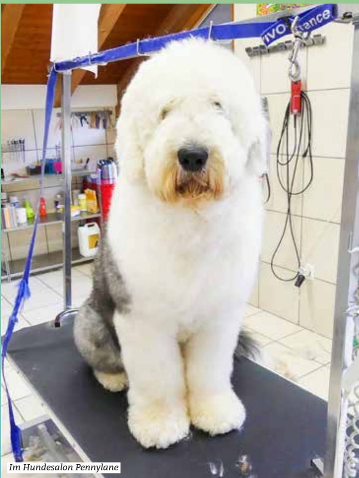
Im Hundesalon Pennylane