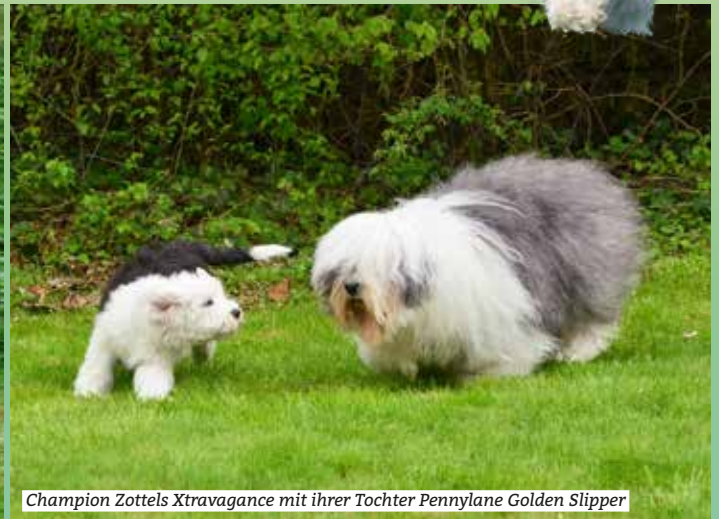
Champion Zottels Xtravagance mit ihrer Tochter Pennylane Golden Slipper