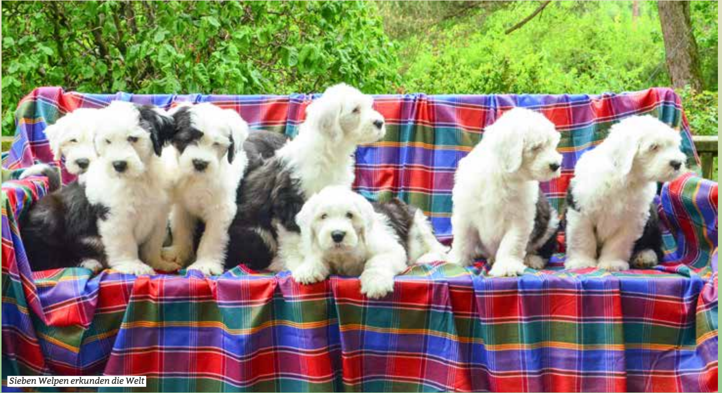
Sieben Welpen erkunden die Welt