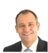
Thomas Matter Nationalrat, ZH Unternehmer

Die Bevölkerung ist herzlich eingeladen. Nutzen Sie die Chance zum Austausch mit Nationalräten und Kantonsrat am 24. August 2023 ab 18.00 Uhr