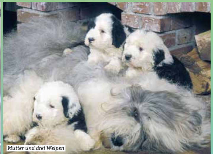
Mutter und drei Welpen

land an der Evolution beteiligt waren. Andere sehen eine Verwandtschaft mit dem aus Schottland stammenden Bearded Collie. Auf jeden Fall wurden 1875 im Zuchtbuch des englischen Kennel-Club die ersten zwei Hunde unter dem Namen «Short Tailed English Sheepdogs» eingetragen.