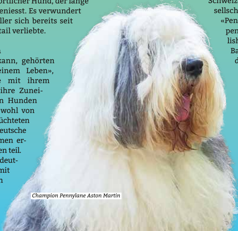
Champion Pennylane Aston Martin

«Um den Welpen einen optimalen Start ins Leben zu geben, versuchen wir, sie in der äusserst wichtigen Prägephase nach kynologisch neuesten Erkenntnissen zu fördern.» Die Zuchterfolge mit vielen Pokalen in den ersten Rängen geben Müller recht.