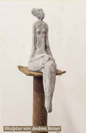
Skulptur von Andrea Reiser