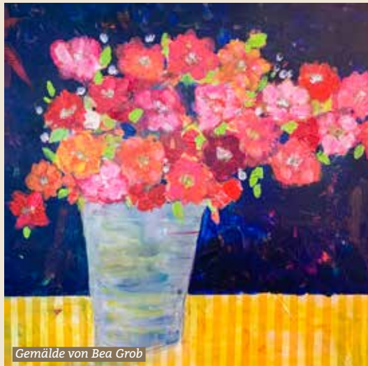
Gemälde von Bea Grob