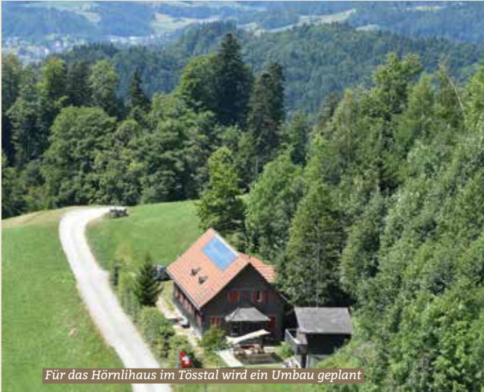
Für das Hörnlihaus im Tösstal wird ein Umbau geplant

Genial ist die Aussicht, zweckmässig die Einrichtung: In den letzten 30 Jahren übernachteten tausende Kinder und Jugendliche in ihren Schlafsäcken im einfach eingerichteten Haus. Dank den günstigen Mietpreisen und den 32 Schlafplätzen ist das Hörnlihaus vor allem bei Jugendgruppen und Schulklassen beliebt. Vermietet wird das Haus durch den Verein Hörnlihaus, welcher das Haus im Jahr 1990 der Firma Sulzer abkaufen konnte. Nach dem Kauf wurde das