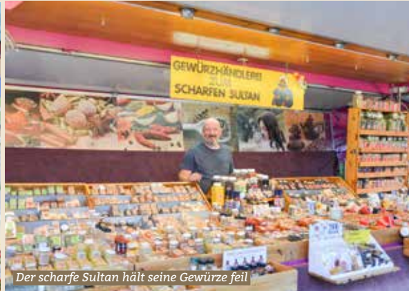
Der scharfe Sultan hält seine Gewürze feil