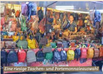
Eine riesige Taschen- und Portemonnaieauswahl