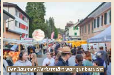
Der Baumer Herbstmärt war gut besucht