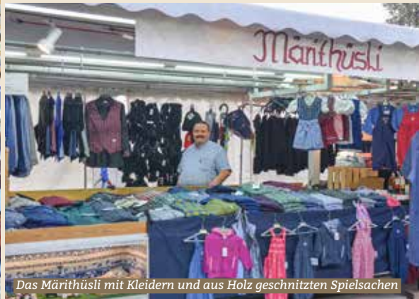
Das Märthüsli mit Kleidern und aus Holz geschnitzten Spielsachen