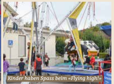
Kinder haben Spass beim «Flying high!»

Am 6. und 7. Oktober verwandelte sich der Dorfkern wieder in einen lebendigen Treffpunkt für Jung und Alt: Der traditionelle Herbstmärt lockte mit einem abwechslungsreichen Angebot, das für jeden Geschmack etwas bereithielt.