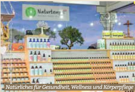
Natürliches für Gesundheit, Wellness und Körperpflege