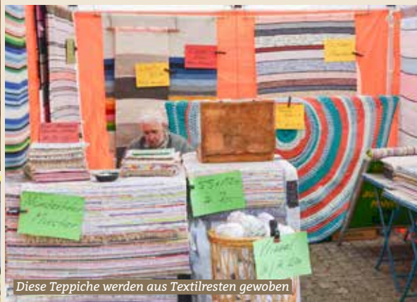
Diese Teppiche werden aus Textilresten gewoben