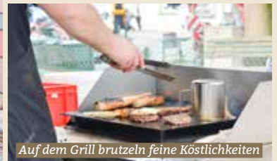
Auf dem Grill brutzeln feine Köstlichkeiten