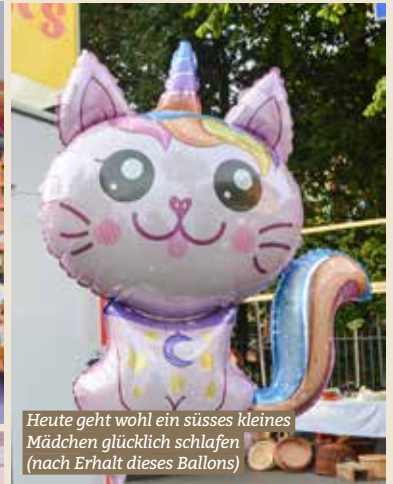
Heute geht wohl ein süßes kleines Mädchen glücklich schlafen (nach Erhalt dieses Ballons)