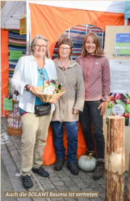
Auch die SOLAWI Bauma ist vertreten