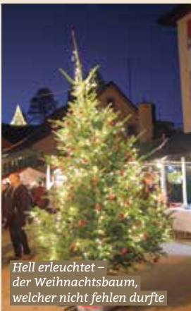
Hell erleuchtet – der Weihnachtsbaum, welcher nicht fehlen durfte