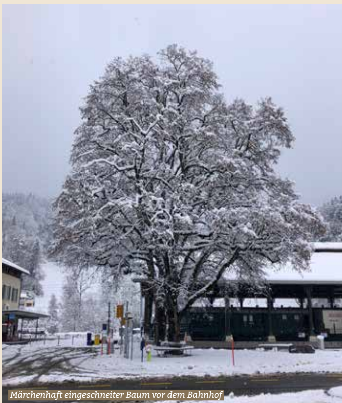
Märchenhaft eingeschneiter Baum vor dem Bahnhof