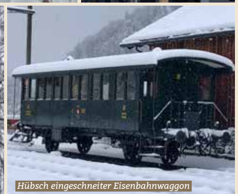
Hübsch eingeschneiter Eisenbahnwaggon