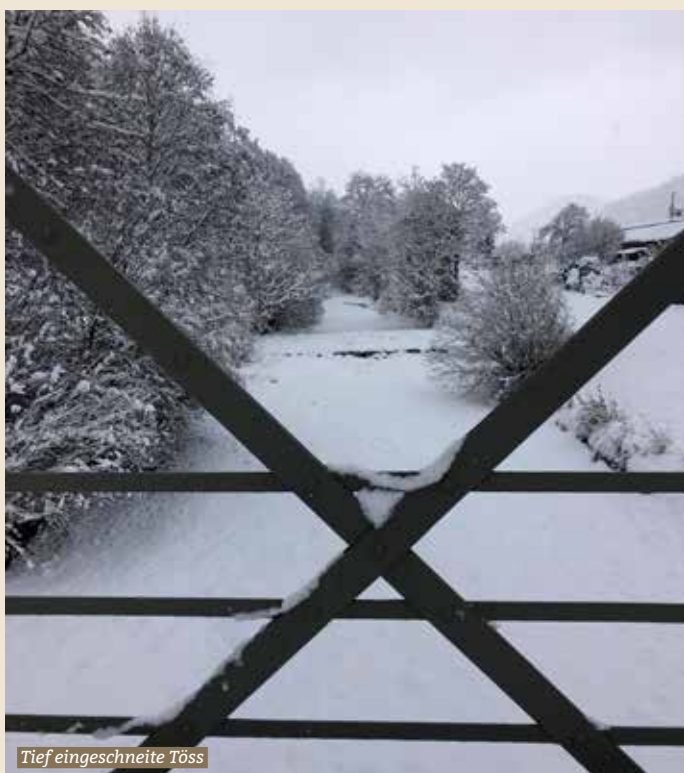
Tief eingeschneite Töss

Mehrmals pro Jahr erstellt der Gemeinderat eine Hochrechnung, um im Rahmen der finanziellen Steuerung der Gemeinde bei Budgetabweichungen gegebenenfalls korrigierend eingreifen zu können. Die letzte Hochrechnung des laufenden Jahres zeigt, trotz Mehrkosten aufgrund von Unwetterschäden und einem intensiveren Winterdienst sowie wegen der durch die Massnahmen zur Eindämmung des Coronavirus bedingten Mindereinnahmen im Hallenbad, eine erfreuliche positive Abweichung zu Budget von über CHF 0,6 Mio.