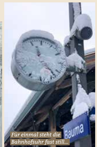
Für einmal steht die Bahnhofsuhr fast still...