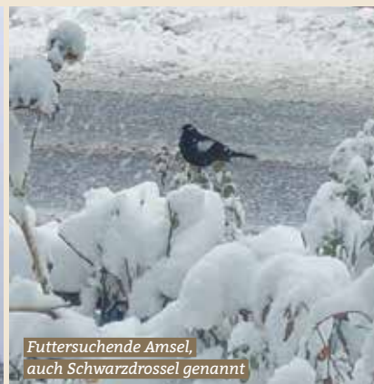
Futtersuchende Amsel, auch Schwarzdrossel genannt