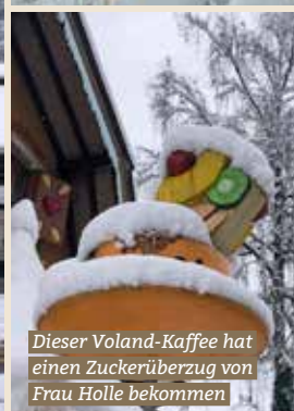
Dieser Voland-Kaffee hat einen Zuckerüberzug von Frau Holle bekommen