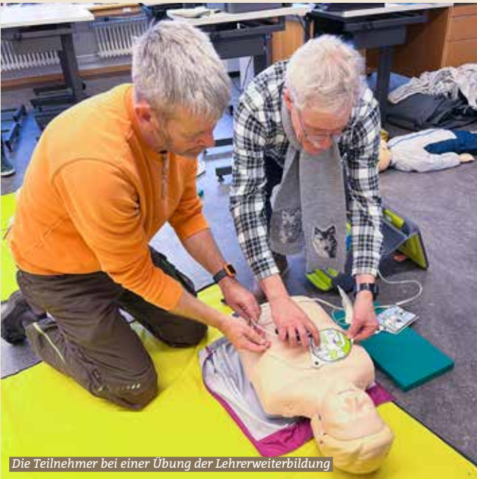
Die Teilnehmer bei einer Übung der Lehrerweiterbildung

Wie reagiert man als Lehrerin, wenn ein Schüler bewusstlos zu Boden fällt? Was versteht man unter dem «Heimlich»-Manöver? Wie funktioniert eine Herzdruckmassage und unter welchen Voraussetzungen kann der Defibrillator eingesetzt werden? Diese und noch andere Fragen wurden am 30. November 2022 im Rahmen einer Lehrerweiterbildung vom Schulungsteam der Rettungsschule SanArena Zürich behandelt.