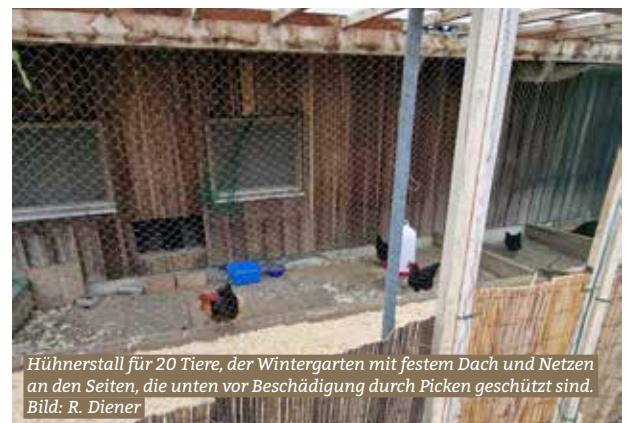
Hühnerstall für 20 Tiere, der Wintergarten mit festem Dach und Netzen an den Seiten, die unten vor Beschädigung durch Picken geschützt sind.