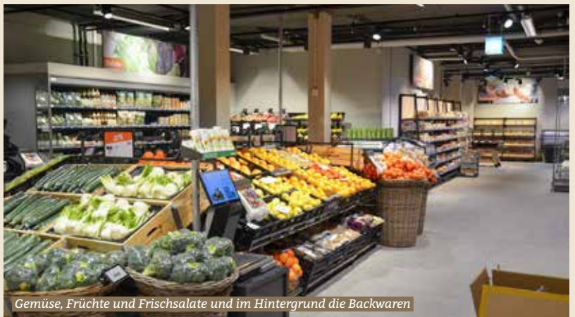
Gemüse, Früchte und Frischsalate und im Hintergrund die Backwaren