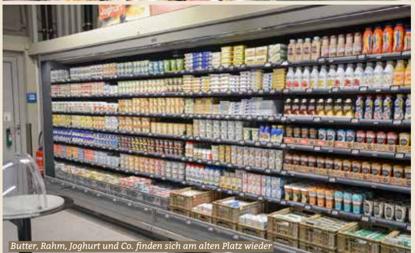
Butter, Rahm, Joghurt und Co. finden sich am alten Platz wieder