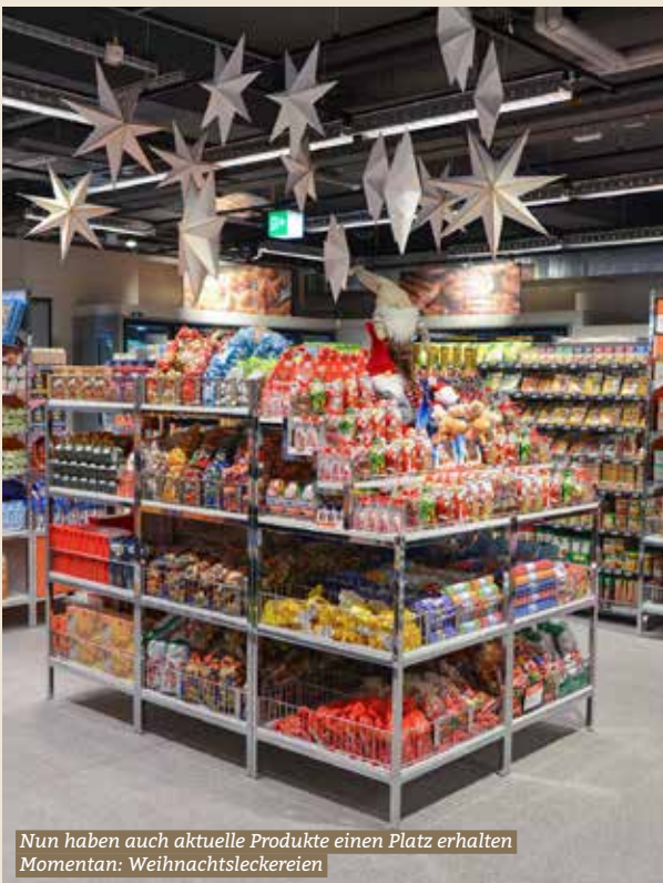
Nun haben auch aktuelle Produkte einen Platz erhalten Momentan: Weihnachtsleckereien