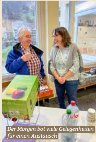
Der Morgen bot viele Gelegenheiten für einen Austausch