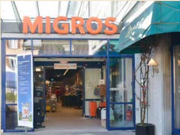
Der Eingang zur Migros ist nun rechts – separat zum Ausgang

weitere Impressionen aus der neuen Migros Filiale in Bauma