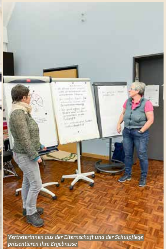
Vertreterinnen aus der Elternschaft und der Schulpflege präsentieren ihre Ergebnisse

An der Sekundarschule Bauma fand am 22. November 2023 ein Workshopmorgen statt, der ganz im Zeichen der Erarbeitung eines neuen Schulleitbildes stand. Dieser Tag markierte einen wichtigen Schritt in der Entwicklung der Schule und ihrer Werte. Die Teilnehmerschaft, bestehend aus Vertretern des Schülerparlaments, der Elternschaft, der Lehrerschaft und der Schulpflege, wurde zu Beginn des Tages mit Kaffee und Gipfeli empfangen, was für eine warme und einladende Atmosphäre sorgte. Um die rund vierzig Teilnehmenden geistig und körperlich auf den Tag einzustimmen, wurden sie zu Aufwärmübungen animiert.