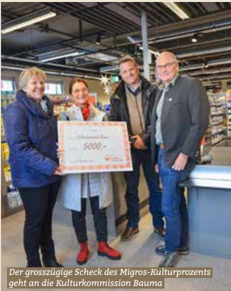
Der grosszügige Scheck des Migros-Kulturprozents geht an die Kulturkommission Bauma