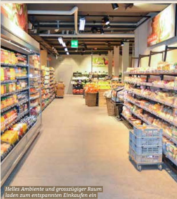
Helles Ambiente und grosszügiger Raum laden zum entspannten Einkaufen ein