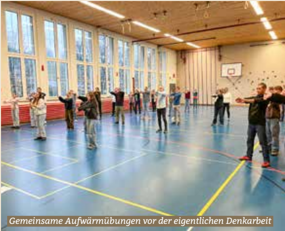
Gemeinsame Aufwärmübungen vor der eigentlichen Denkarbeit