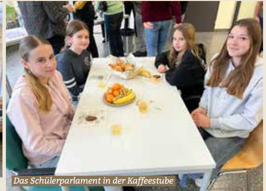
Das Schülerparlament in der Kaffeestube