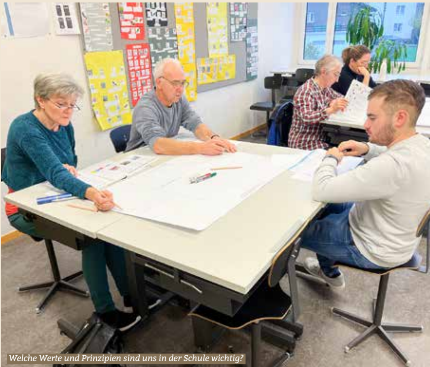
Welche Werte und Prinzipien sind uns in der Schule wichtig?