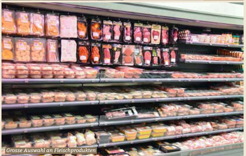
Grosse Auswahl an Fleischprodukten