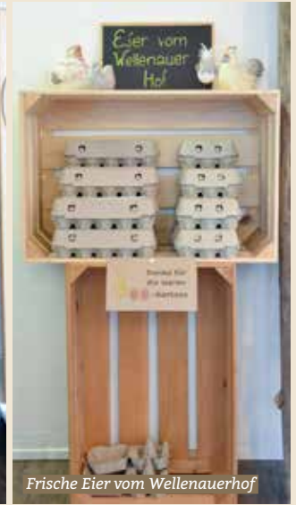
Frische Eier vom Wellenauerhof