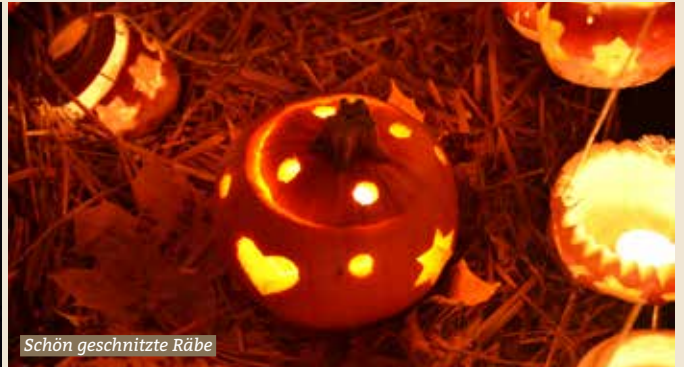
Schön geschnitzte Räbe