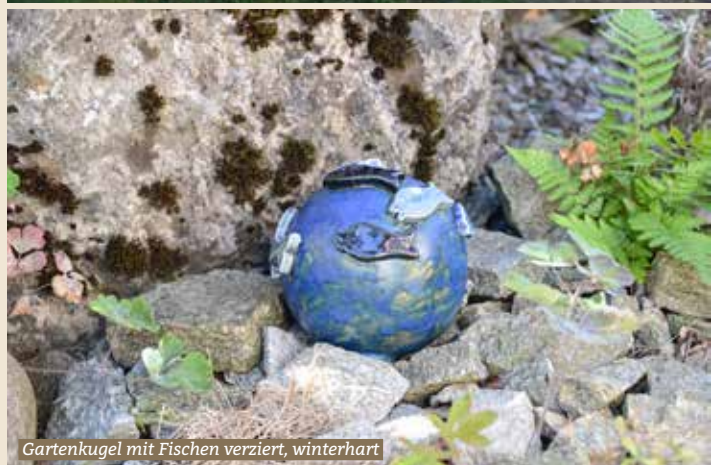
Gartenkugel mit Fischen verziert, winterhart