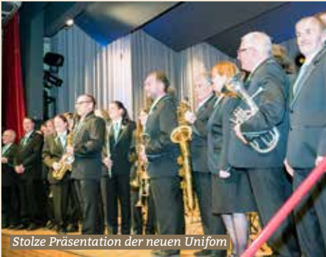
Stolze Präsentation der neuen Uniform