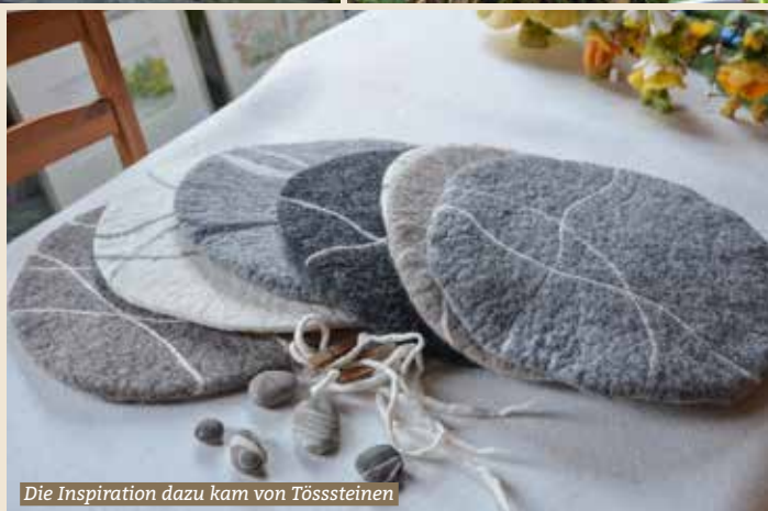
Die Inspiration dazu kam von Tösssteinen