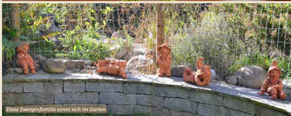
Diese Zwergenfamilie sonnt sich im Garten