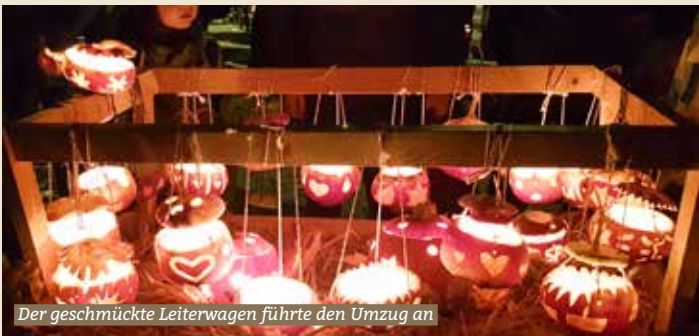
Der geschmückte Leiterwagen führte den Umzug an