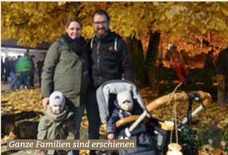
Ganze Familien sind erschienen