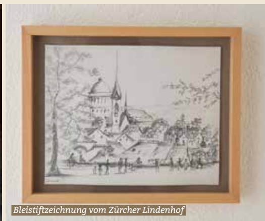
Bleistiftzeichnung vom Zürcher Lindenhof