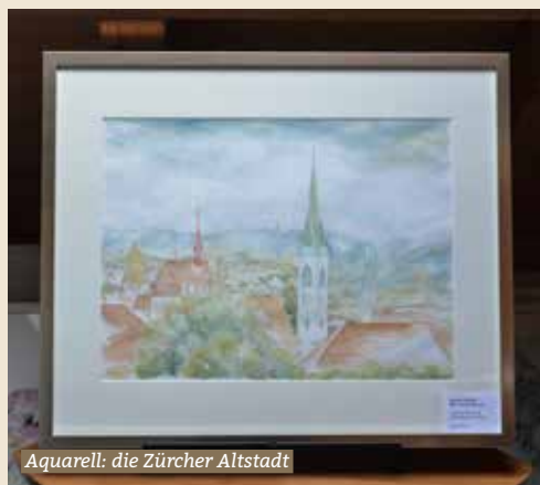
Aquarell: die Zürcher Altstadt

weitere Impressionen aus Elfi Breitschmids Atelier