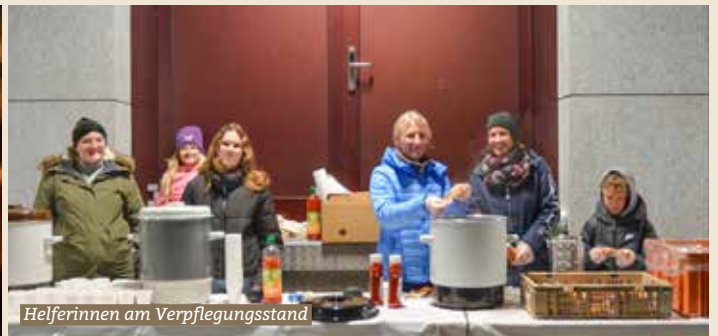
Helferinnen am Verpflegungsstand

Wenn es wieder kalt und früh dunkel wird, ist es Zeit für den traditionellen Räbeliechtliumzug. Kunstvoll geschnitzte Räben, Lieder, Lichter und strahlende Kinderaugen verleihen dem Umzug einen ganz besonderen Zauber.