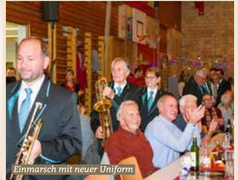
Einmarsch mit neuer Uniform