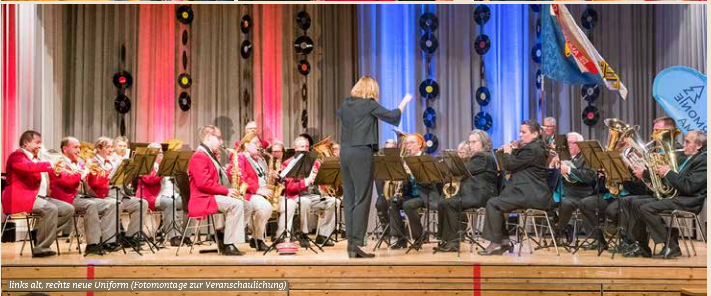
links alt, rechts neue Uniform (Fotomontage zur Veranschaulichung)