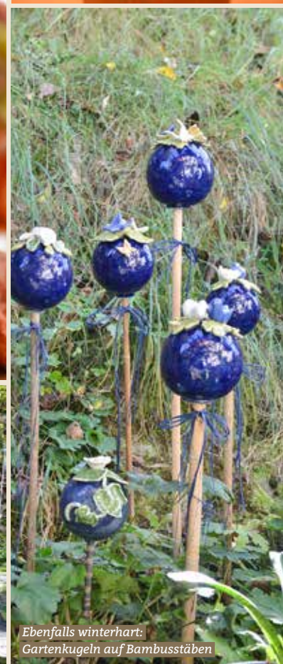
Ebenfalls winterhart: Gartenkugeln auf Bambusstäben