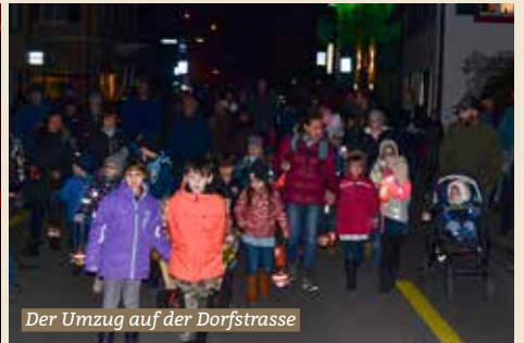
Der Umzug auf der Dorfstrasse