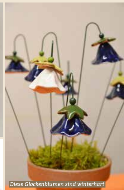
Diese Glockenblumen sind winterhart