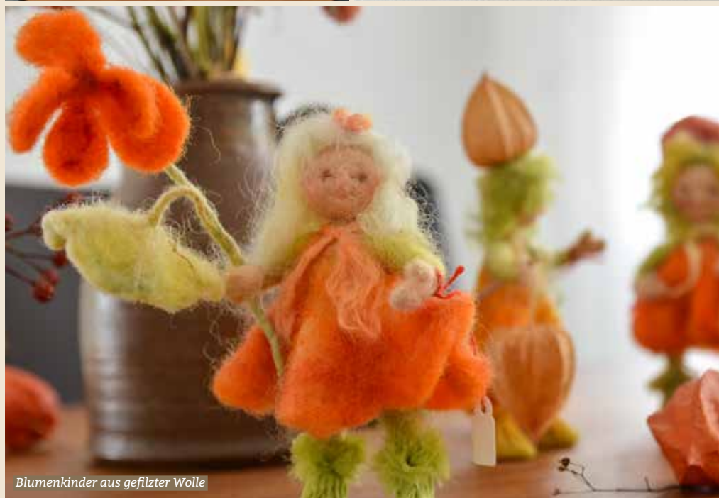
Blumenkinder aus gefilterter Wolle