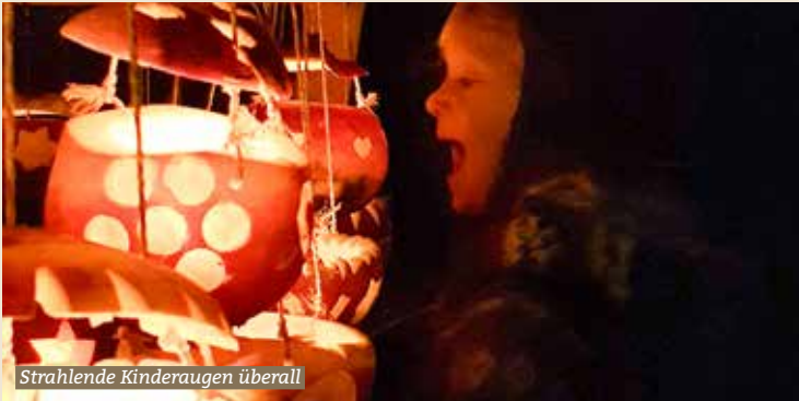
Strahlende Kinderaugen überall