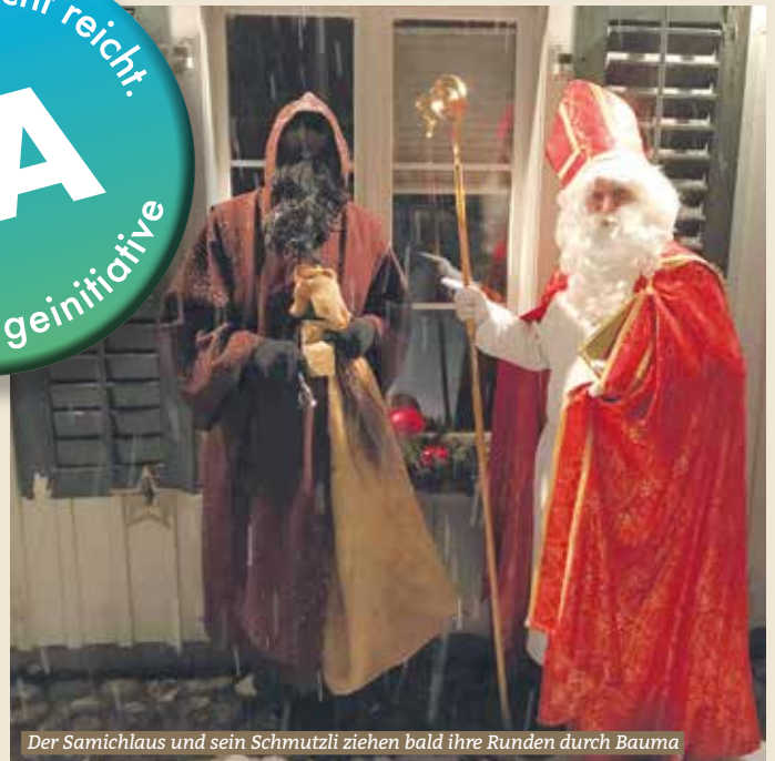
Der Samichlaus und sein Schmutzli ziehen bald ihre Runden durch Bauma